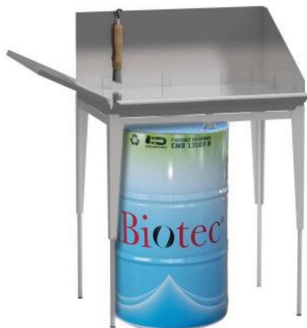
Fontaines à solvants à partir de 50 % dans l'eau