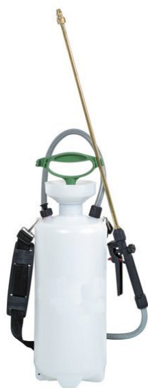
Pulvérisateurs basse pression avec rinçage à l'eau à partir de 20 % dans l'eau