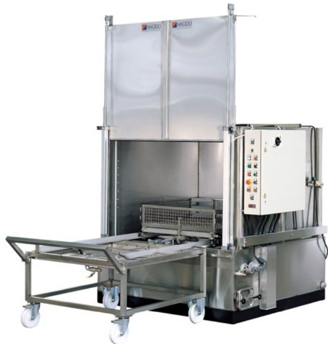
Machine de lavage par aspersion à partir de 20 % dans l'eau