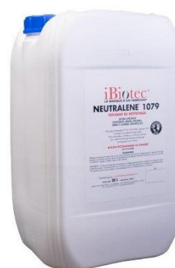
Bidon 20 L

code article 514931 fiche de données de sécurité 108212