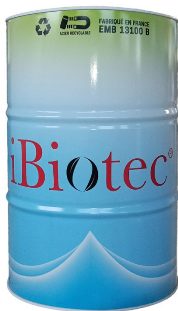
Fût 200 L

code article 515110 fiche de données de sécurité 108212