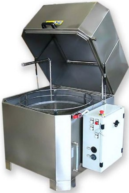
Panier à rotation ou en translation