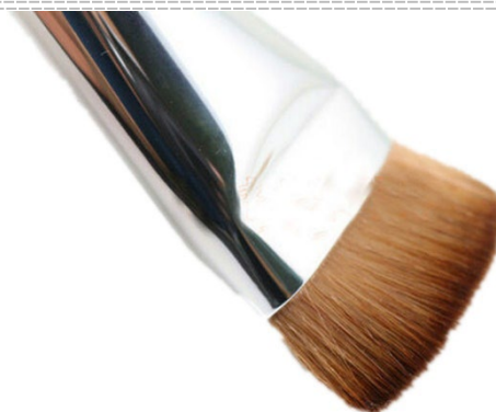
Dégraissage avec brosse