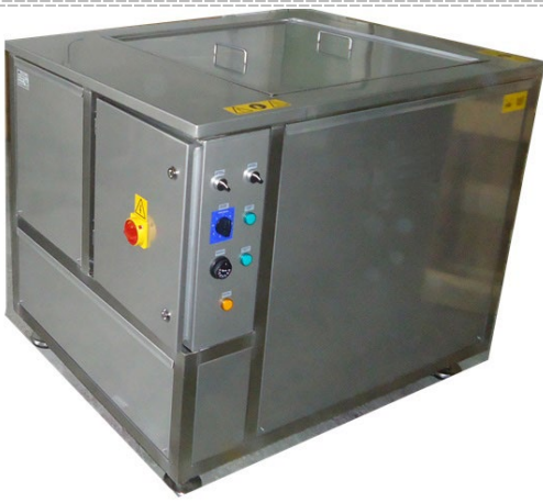
Bac ultrasons à partir de 20 % dans l'eau